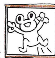
タイプン・カワイイ