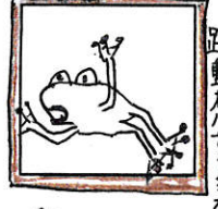
正統派イラストター